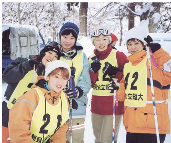
山楽荘の下で撮りました。

三人のスタッフは、大山スキー場で各大学の実習を重ね十分に熟知している。手伝う岡大体育科の学生もここで経験をつんでいる。総員が現場を知っていることで、当初から大きな安心感を持てた。宿の選定は、しつかり雪道を歩くことでウォーミングアップさせ、けがから身体を守ることを第一に考えた。集団の生活をねらうには、個室より、複数で宿泊させるのがよいなどの結論に達した。このようにして二十一年のスキー実習が無事に歴史を刻んでいる。