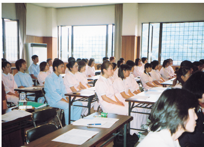
平成13年度 実習出発式

第一段階の実習は特養であり、施設の日課にそって基本的な援助技術方法のみならず、通所サービス、リ