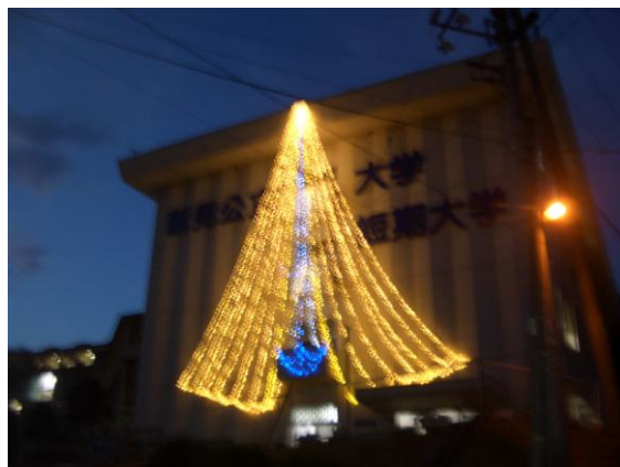
大学3号館 イルミネーション

また1年生43人はお囃子隊を組み、新見短大オリジナルの「田遊び」「土下座楽」を笛と太鼓で、「イケマー」を太鼓で演奏した。